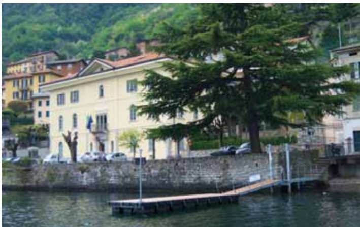
Pontile comunale Municipio

Realizzati lavori di adeguamento sistema di riscaldamento scuola primaria. (Spesa € 10.000)