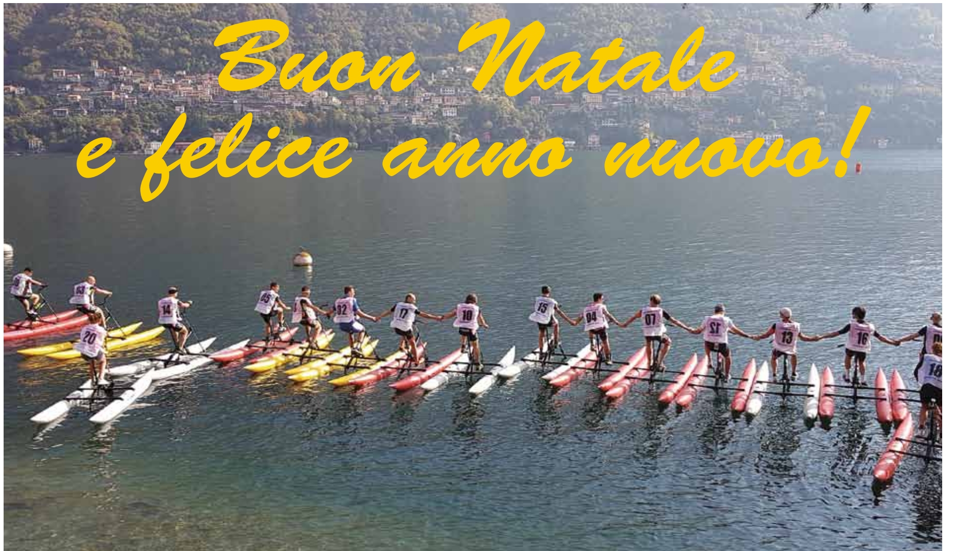
Water Bike I trofeo Championship Italia

A breve i frutti delle piantine regalate dal Comune