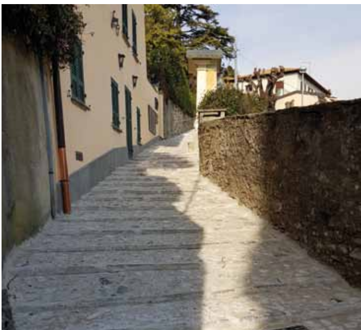
Scalinata di Germanello

Approvato l'atto unico di progettazione per la riqualificazione della scalinata di Via Soldino, che prevede un importo complessivo di € 56.000.