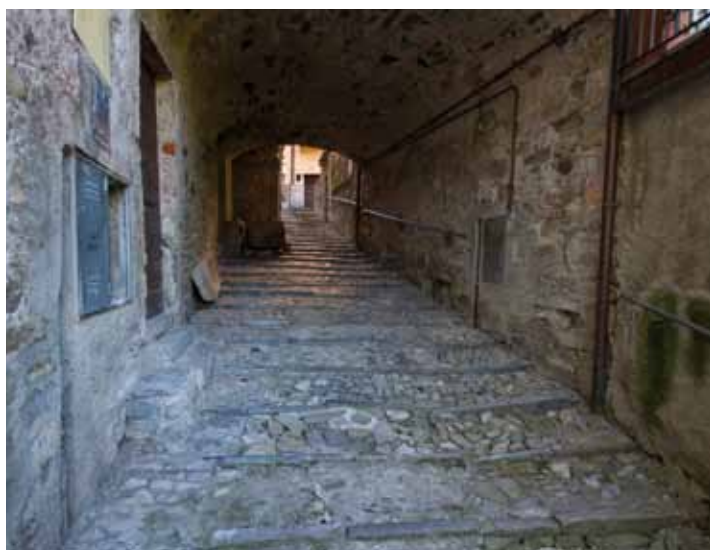
Scalinata di Soldino (sopra)

Approvato l'atto unico di progettazione per la riqualificazione della scalinata di Via Soldino, che prevede un importo complessivo di € 56.000.