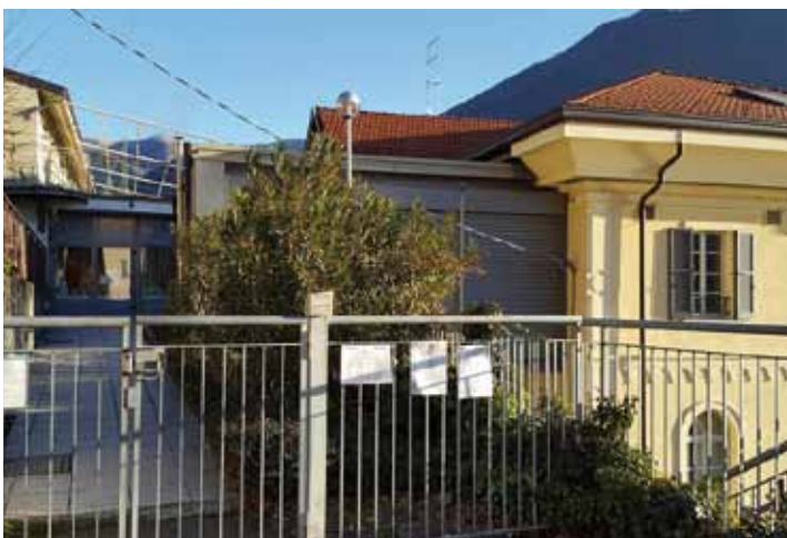
Riscaldamento scuola e Asilo

Nella foto allegata si identifica in rosso l'area destinata al nuovo parcheggio.