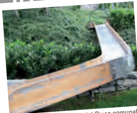
BRIENNO, con lo scivolo del Parco comunale