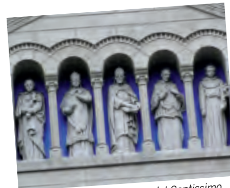
CERNOBBIO, con la chiesa del Santissimo Redentore