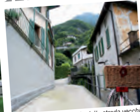
LAGLIO, con uno scorcio dalla strada vecchia Regina Teodolinda