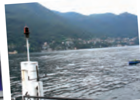
MOLTRASIO, con l'Imbarcadere