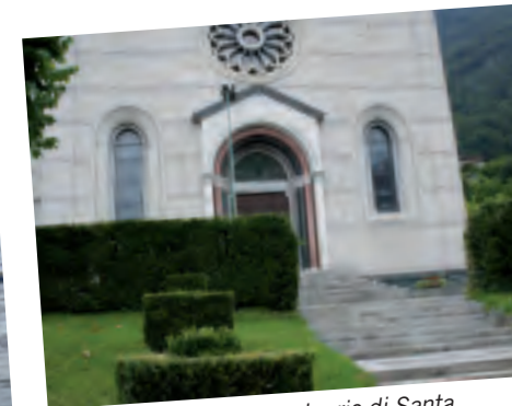
MASLIANICO, con il santuario di Santa Teresa del Bambino Gesù di Lisieux