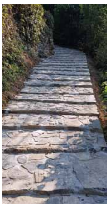
Tana della Volpe prima e dopo i lavori di sistemazione

Questo terribile anno che sta finendo ha, in qualche modo, compromesso la normale esecuzione dei lavori programmati.