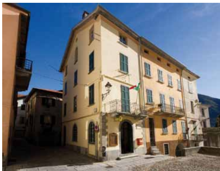
Palazzo comunale piazza Salterio