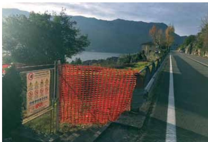
Lavori per il parcheggio Ticée