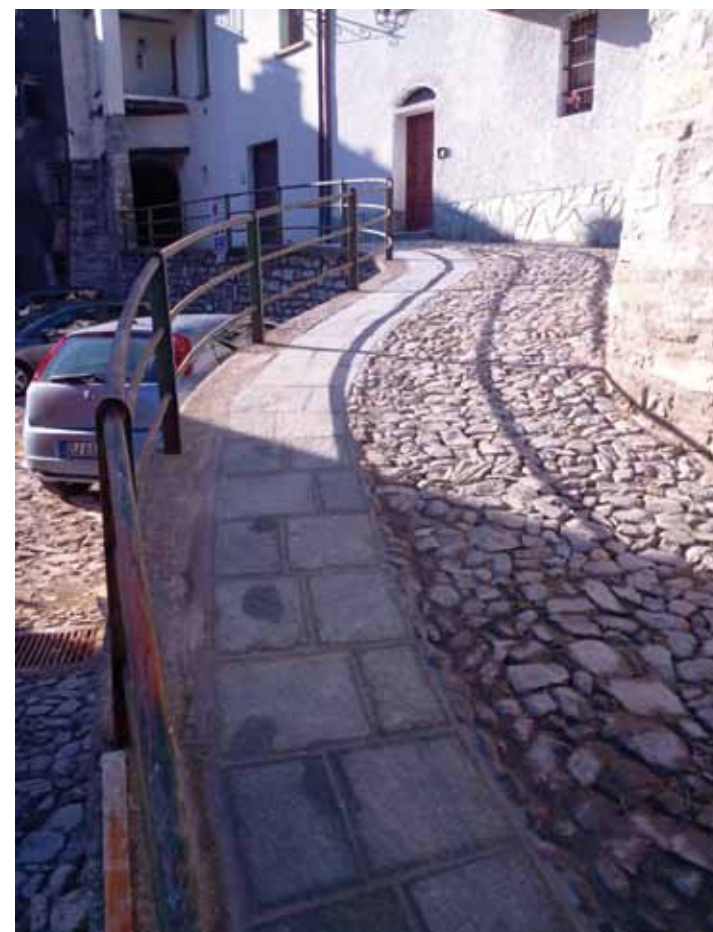
Sopra, sotto e in basso 3 vedute di Torriggeria Alta

Eseguiti lavori di manutenzione straordinaria nelle aree Piramide, cimitero e parco delle Rimembranze.