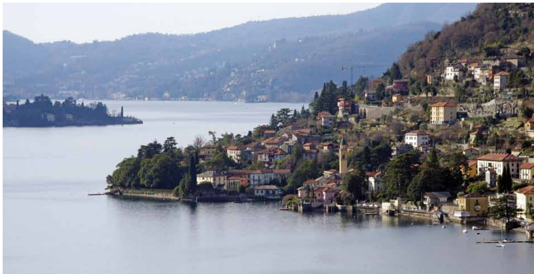
Panoramica di Laglio

Quest'anno una produzione abbondante e di qualità eccellente