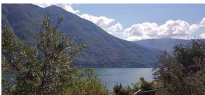
Parco degli ulivi

O aspettiamo la prossima epidemia che risolverà il problema in radice, per pensarci?